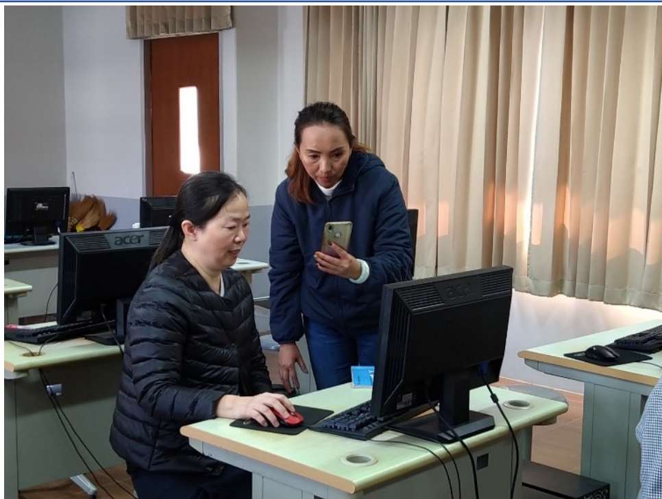
學員認真的把老師操作紀錄下來。