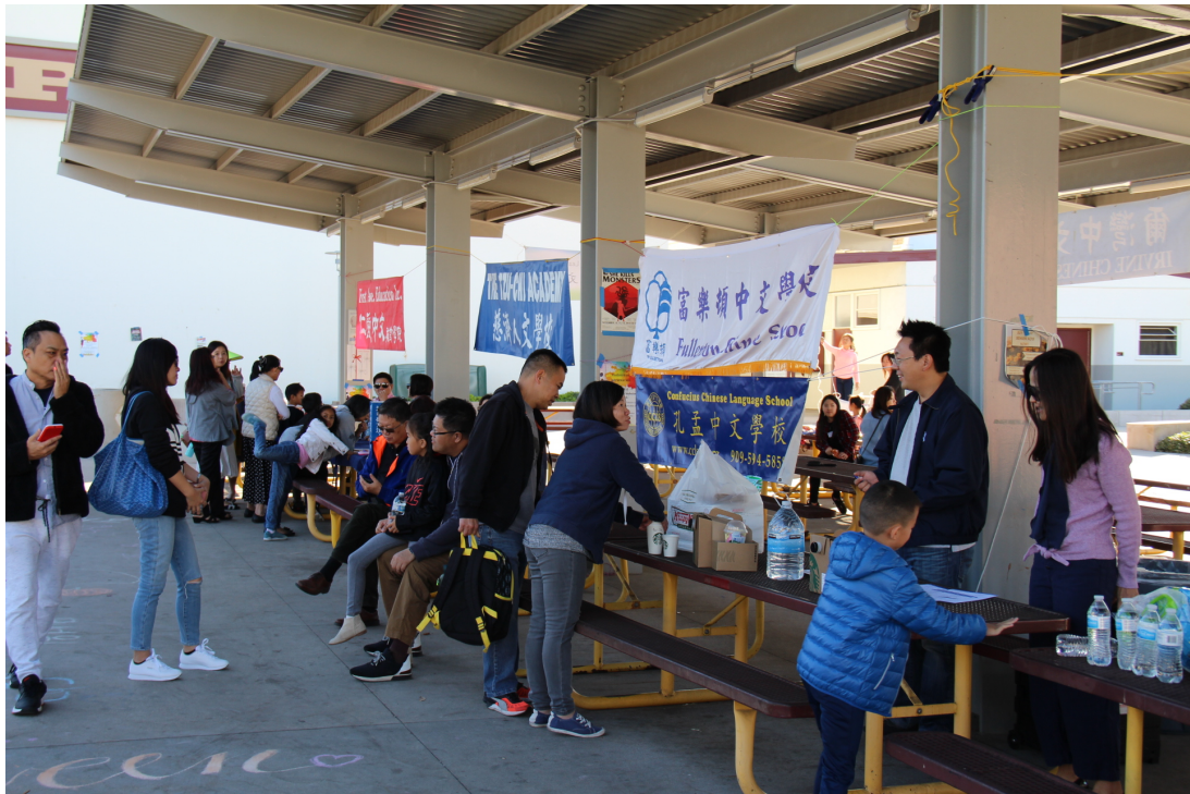
比賽當天各學校攤位一景

為了鼓勵學生們的踴躍參與，每位參賽者均發給「參加獎」獎狀，以資獎勵，各組參賽學生則以參賽總人數之30%為優勝而評選名次，並頒發獎盃，共201位中文學校及主流學校學生獲得授獎名次上台接受獎勵。