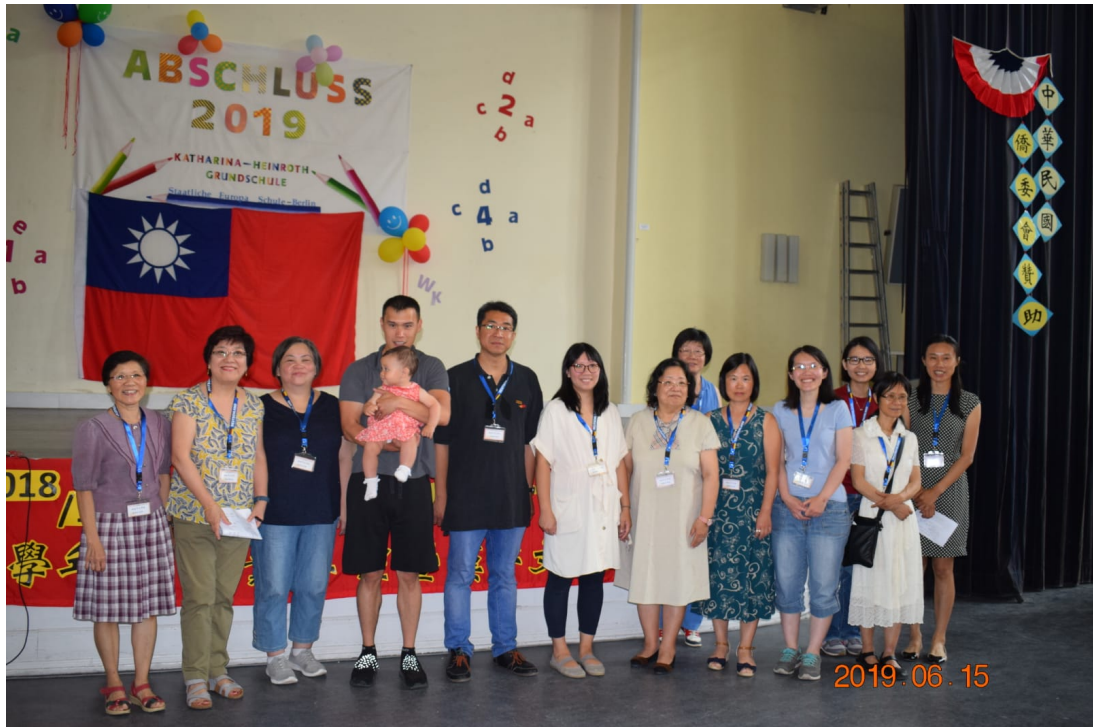
柏林中文學校全體老師