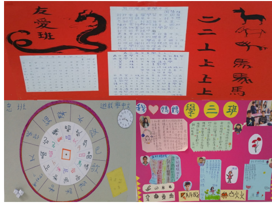
壁報比賽一，二，三名