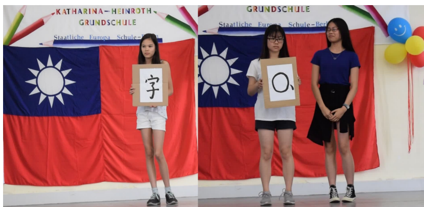
看圖猜成語 (1. 白紙黑字, 2. 可圈可點)