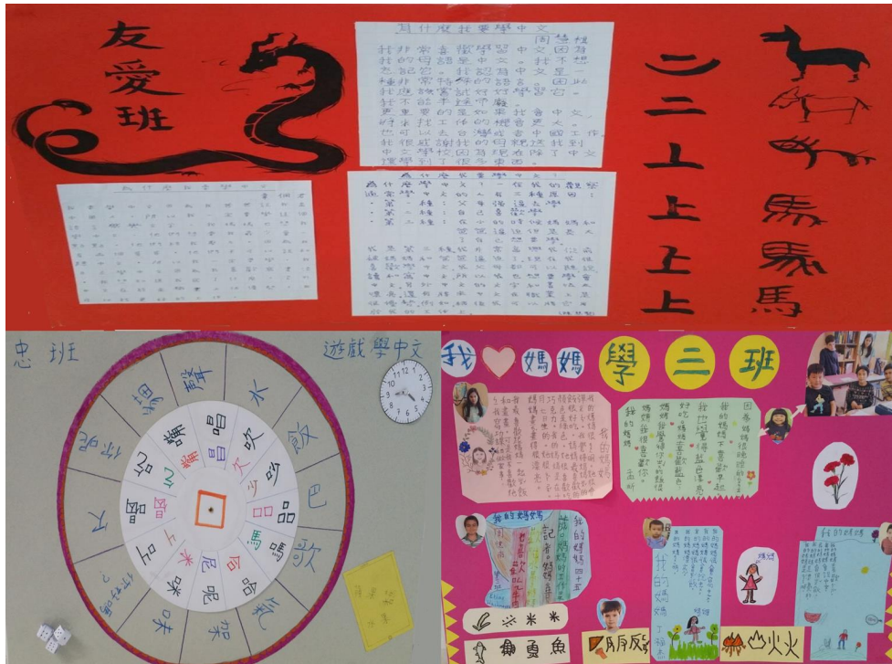
壁報比賽一，二，三名