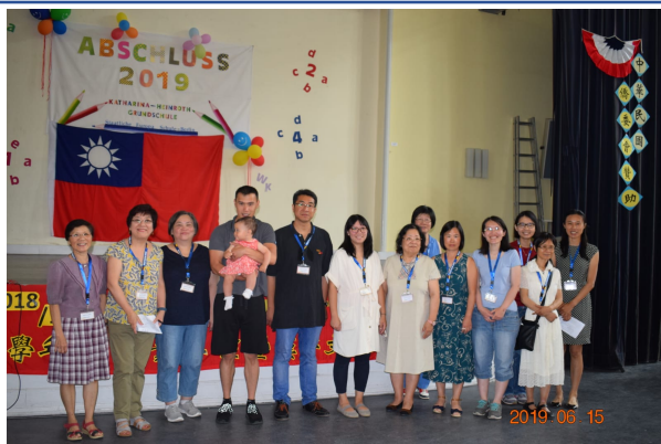
柏林中文學校全體老師