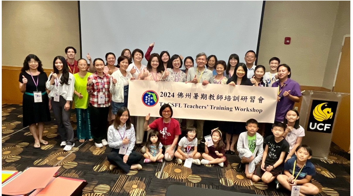
始業式上兩位巡迴講座老師與學員合影