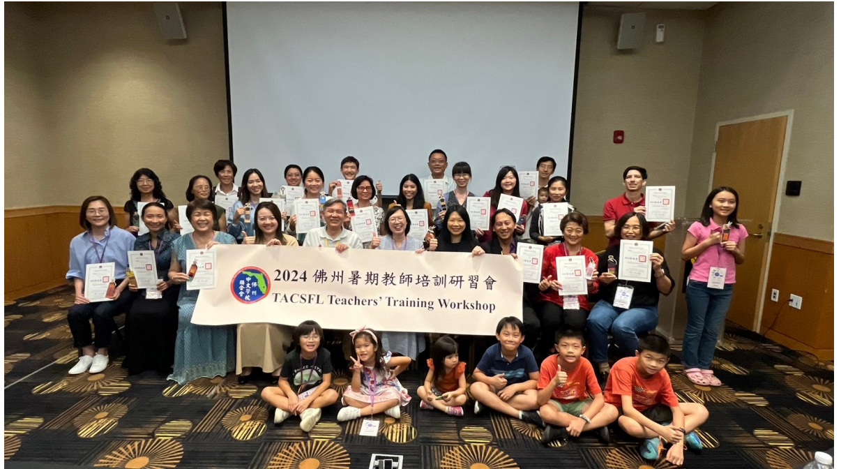
結業式頒發結業證書後合影