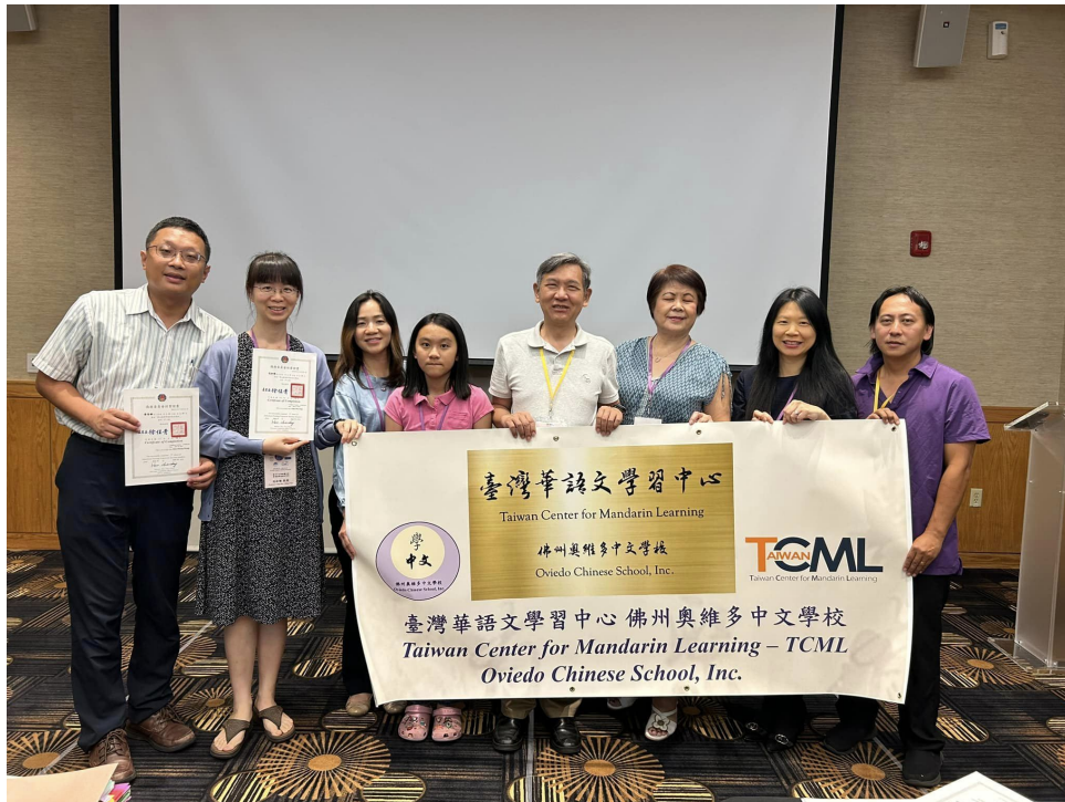
佛州奧維多中文學校老師們參加教師研習會