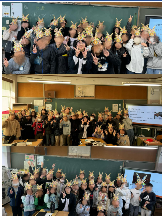
陳校長跟三個班級的五年級學生們大合照