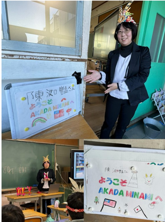
學生們為了迎接陳如豔校長，特別製作的歡迎板