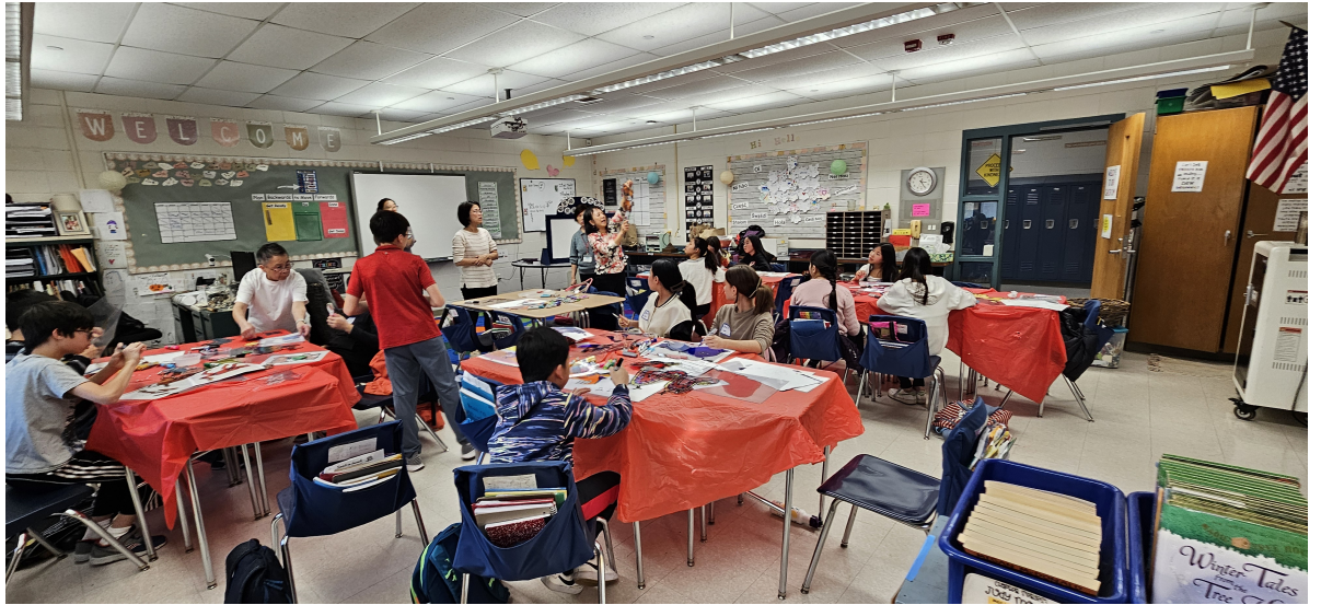
老師說明釘扣放上皮影偶的做法