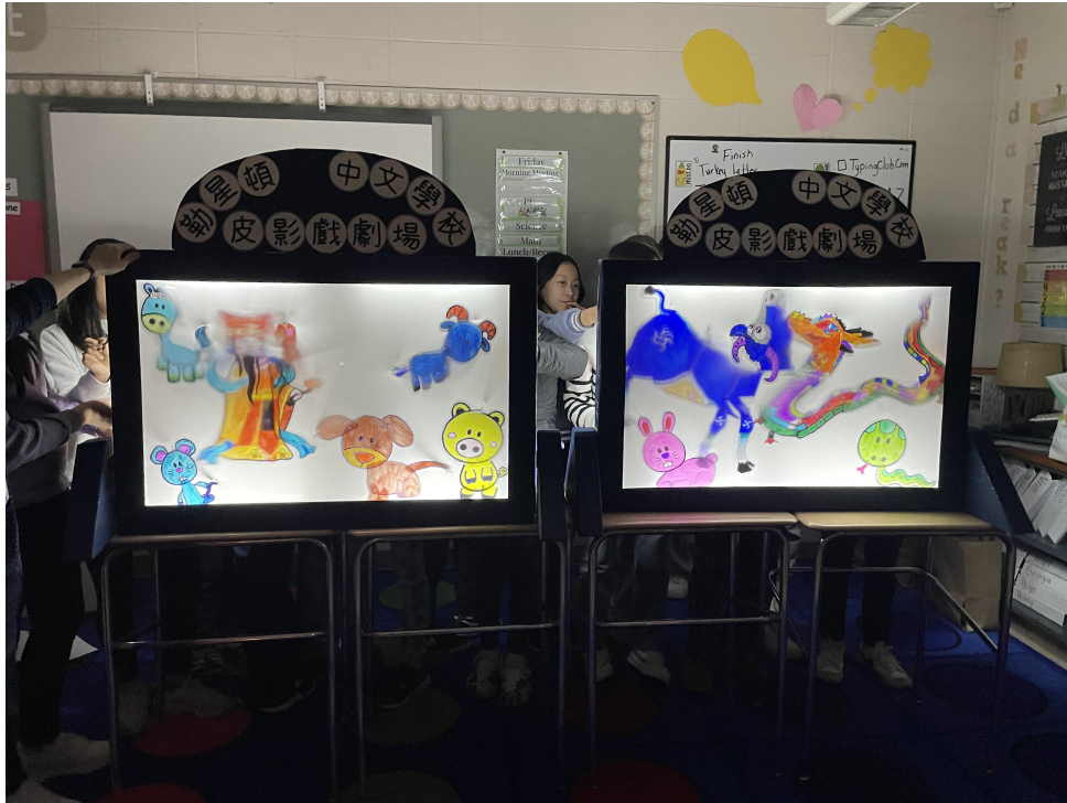
皮影偶的展示效果