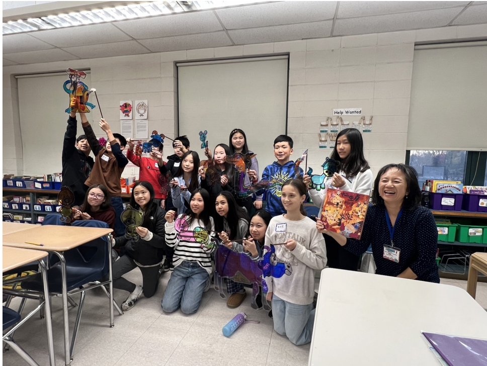
學生們與自己的皮影偶合照