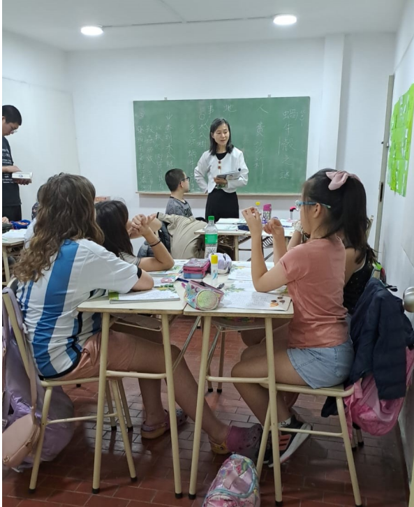
認真聽取比賽規則