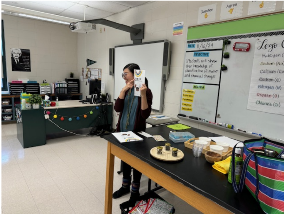
銀魚老師帶來了三種茶葉讓同學們觀察其外型和香味的不同