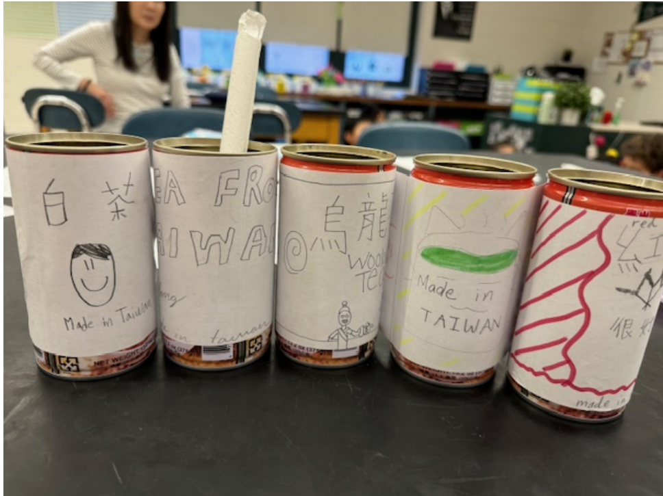
同學們設計的茶罐外包裝