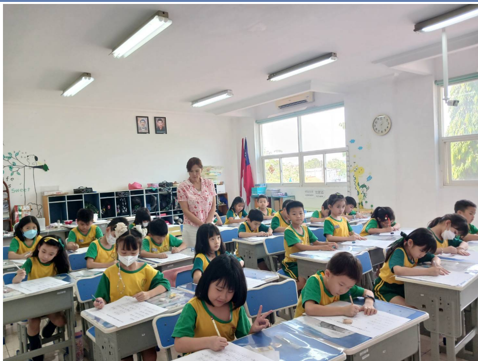
二年級硬筆字比賽，小朋友各個聚精會神，認真態度百分百