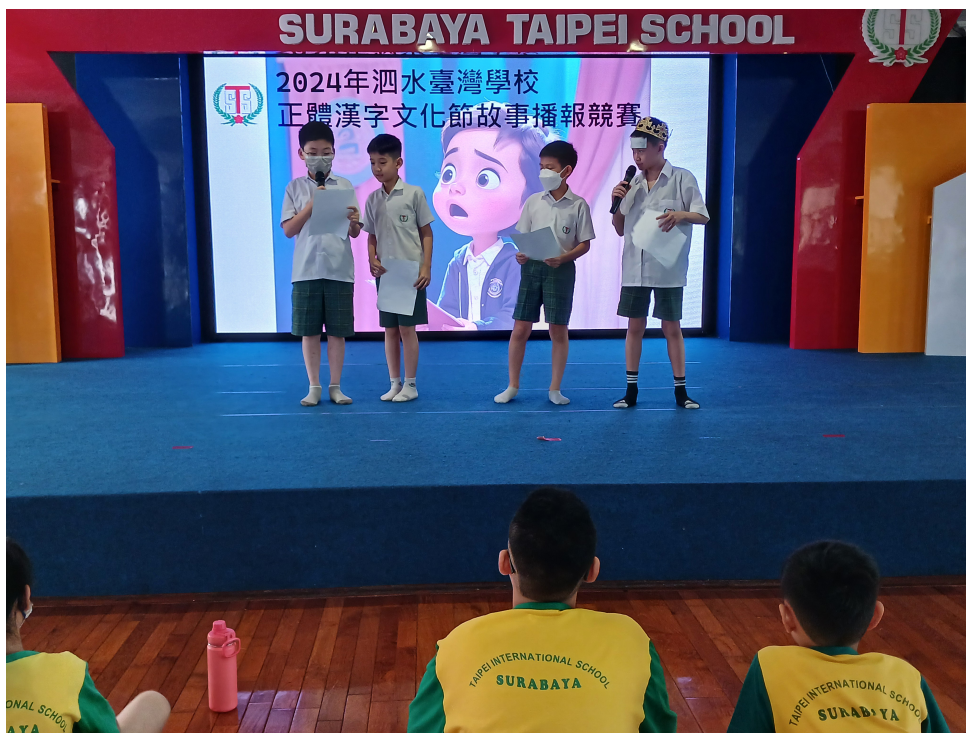
自找搭檔報名參加故事播報，過程中認真準備，值得肯定

我們藉由競賽，期待學生平時能注意：字形結構、語音聲調、語言表達的流暢、甚至是團隊合作默契。