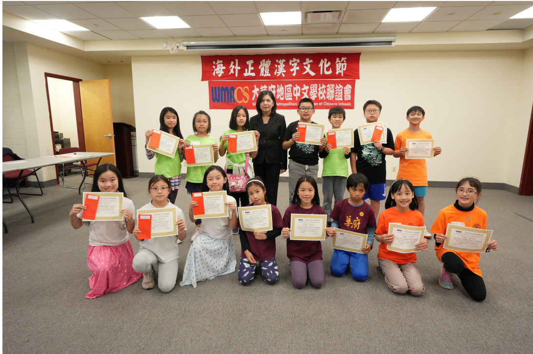
恭喜得獎的小學組同學