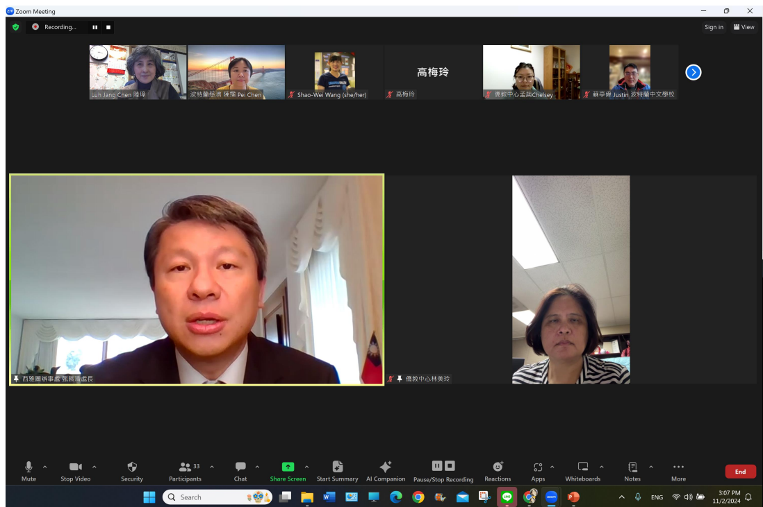
駐西雅圖台北經濟文化辦事處處長 甄國清 致詞