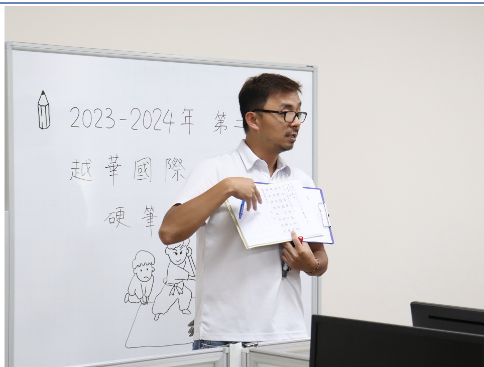
教導主任說明比賽規則與辦法