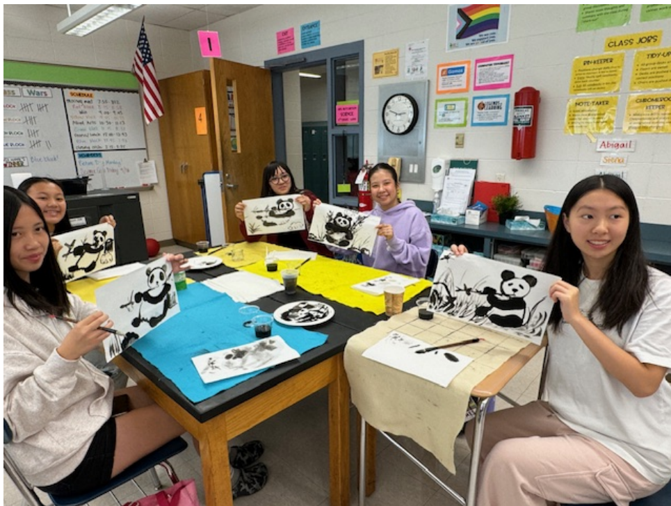
九年級的女同學展示自己所畫的貓熊作品。

今年勒星頓在文化課系列課程的安排，除了介紹各主題文化的歷史來由，和藝術欣賞等，手作部分是學校設計文化課的最主要的重點。這次的國畫課同學們透過練習毛筆，墨水，水彩等工具親身體驗畫國畫不同於一般西畫的方式，希望這堂文化課，讓學生們透過國畫能夠體會到中華文化的深厚底蘊，從而促進文化的傳承和發揚。