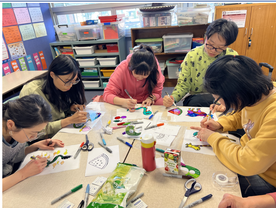
老師發揮創意，把動物的色彩畫得五彩繽紛