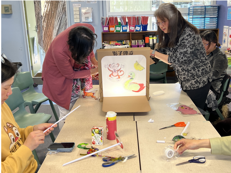
小舞臺呈現現代圖騰「水果或動物」的皮影戲