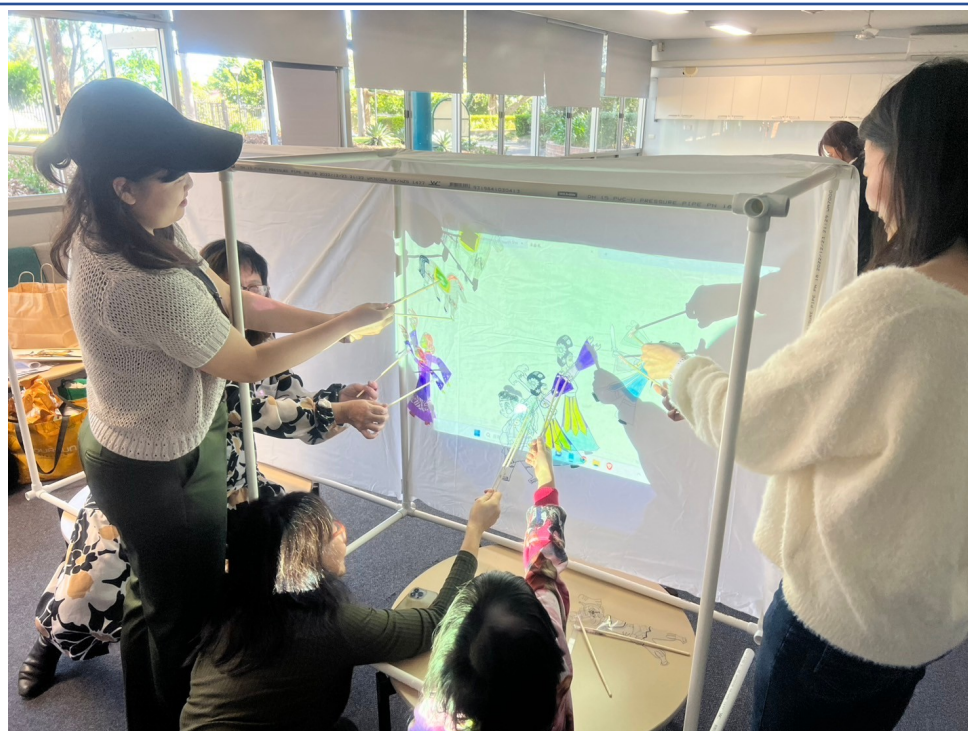
老師在後臺練習控制皮影的有趣畫面