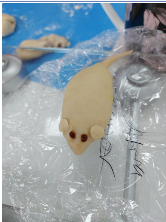
小朋友唯妙唯俏的作品