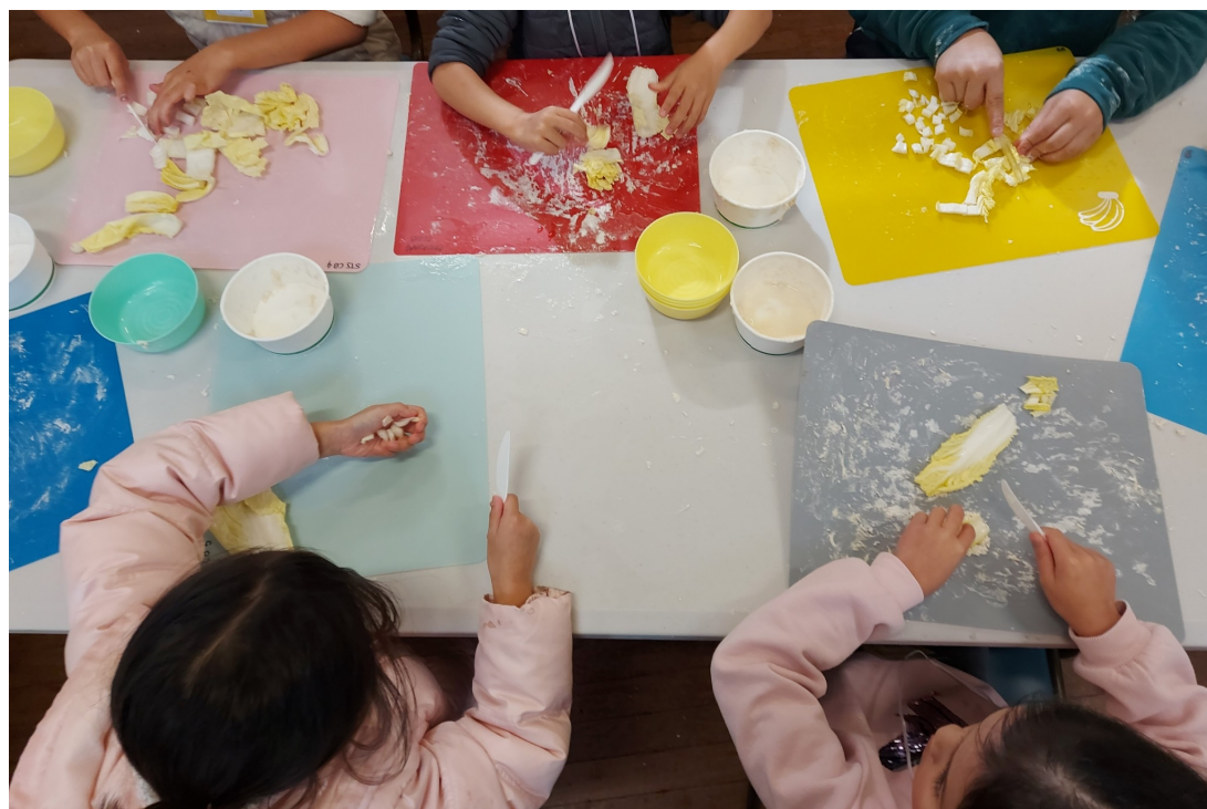
我們準備檸檬麵皮了