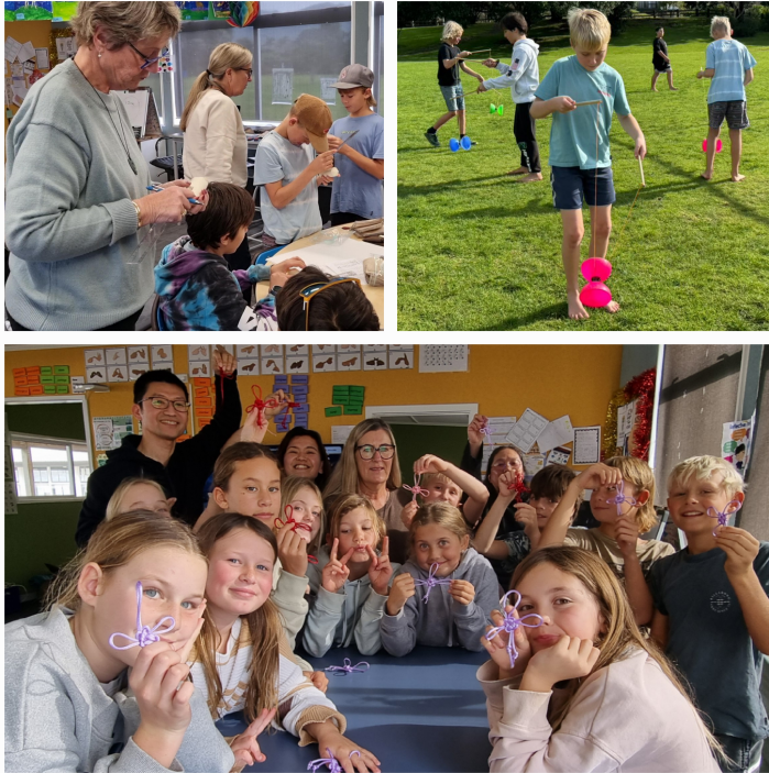
Waihi Beach School的師生專注參與多元課程、自信展現學習成果