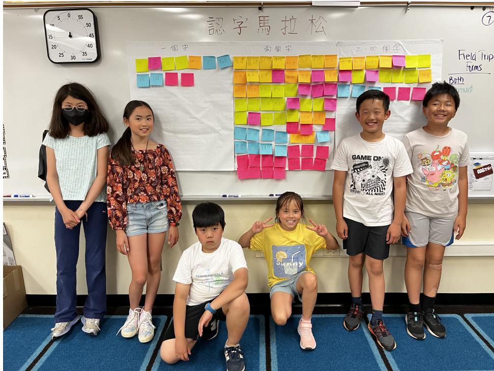
四年級學生，以遊戲方式，複習貼在白板上全部字詞後，開心合影