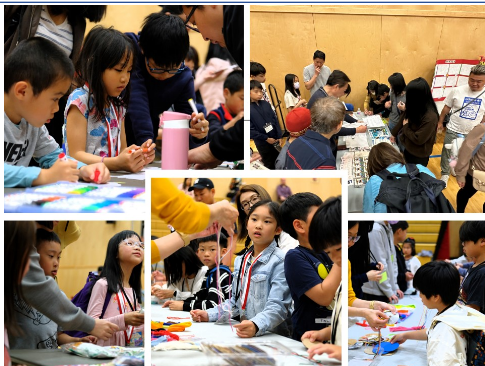
各項活動深受學生和家長喜愛