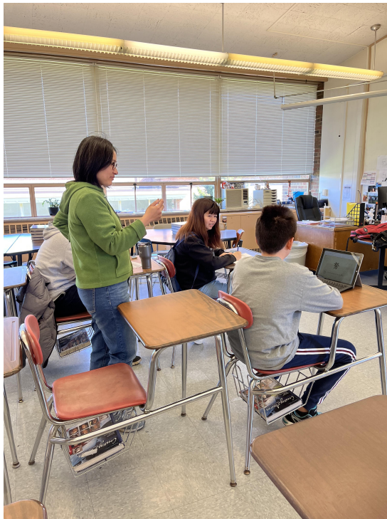
六年級同學識字識詞考試

克里夫蘭中文書院在每年春季班舉辦的中文正體字識字識詞比賽活動，已行之有年。此活動於三月下旬開始，一直到五月初結束，各班級學生會輪流參加考試。對於傳統班的學生們，老師會隨機挑選過去學過的15個生字，要求學生回答及造詞。另外，會挑選10個生詞，要求學生造句。對於中文第二外語班的學生們，考試主要以對話方式進行，要求同學們能回答與測驗官的基本日常生活對話。另外，對於中高年級的學生，會再要求自我介紹的部分。透過對話來評量學生的聽力以及對正體字發音與說話的技巧。本次活動圓滿結束，已在五月初將各獎項及獎狀頒發給參加的同學，提高學生學習興趣及鼓勵學生們繼續學習中文。