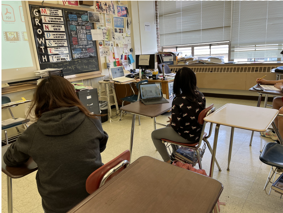
四年級同學識字識詞考試