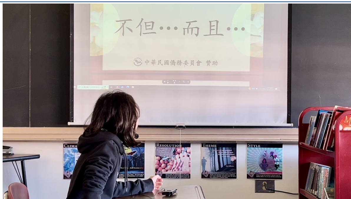
五年級同學識字識詞考試