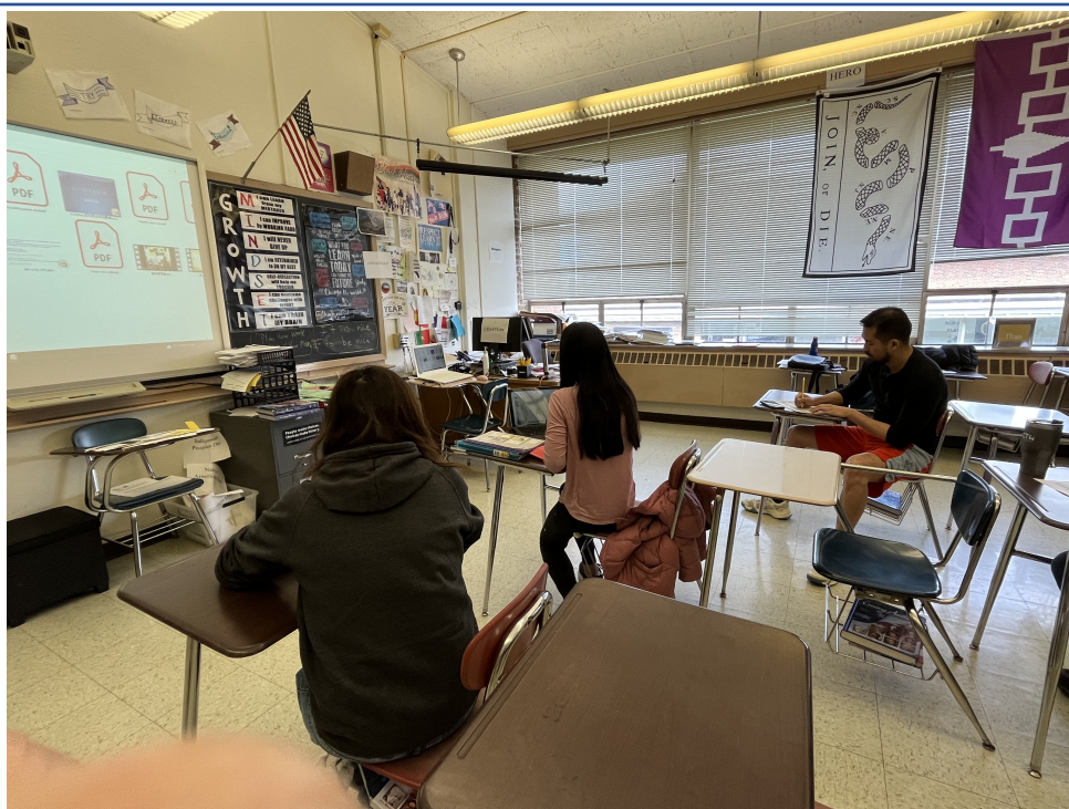
四年級同學識字識詞考試