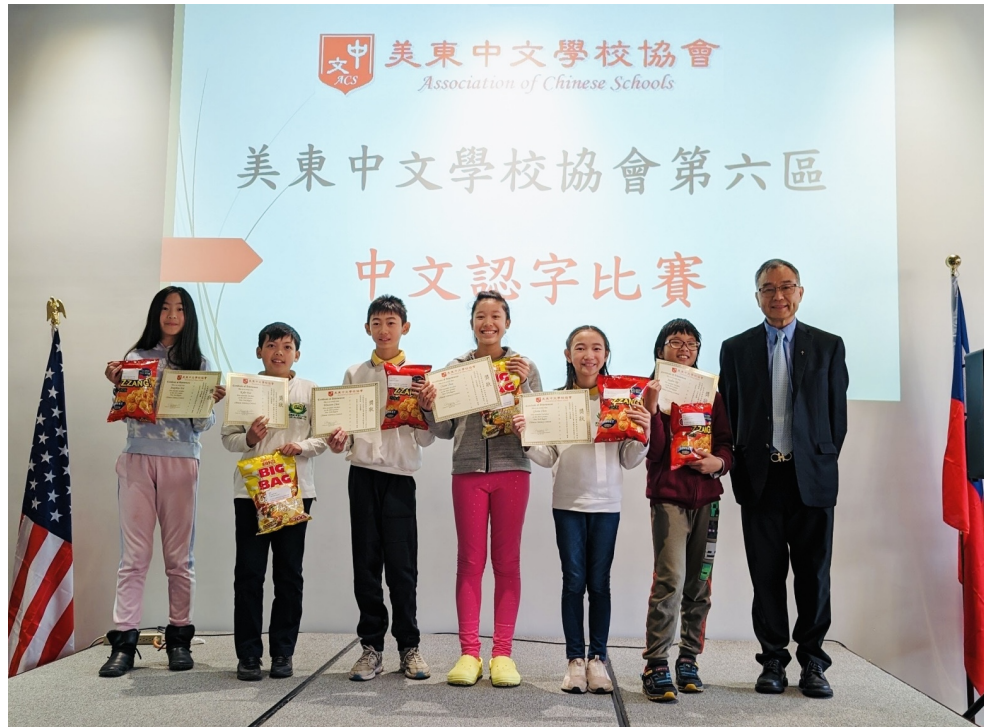
李磐石校長與獲勝學生合影