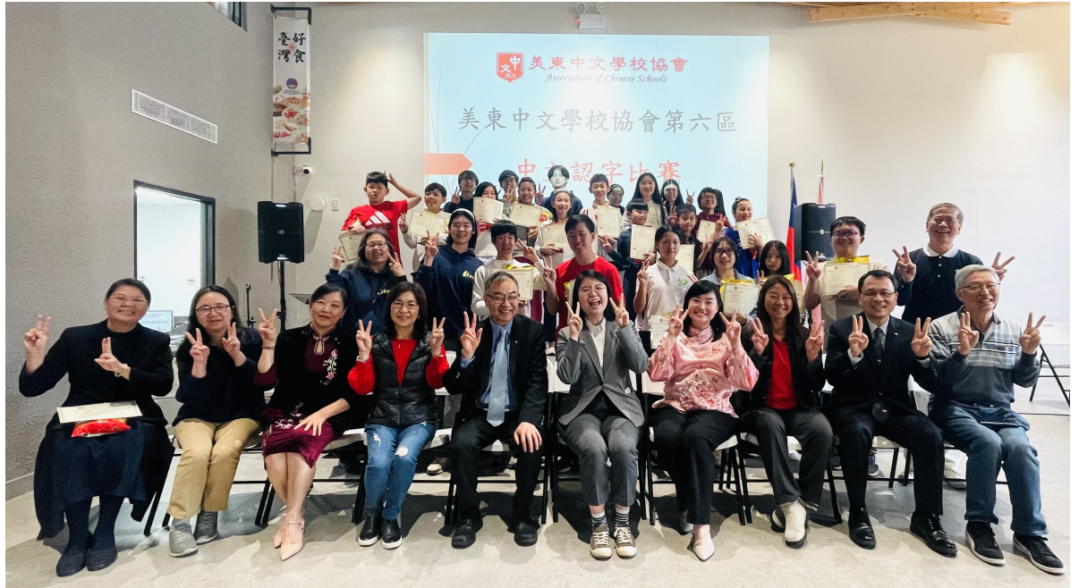
大合影：參賽學生在領獎台上笑顏逐開