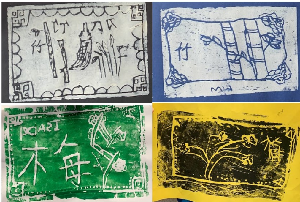
文字意境版畫創作

學生們對這個課程反應非常熱烈，從創作草稿、製版、上色到最終印製的整個過程，都讓他們感受到了自己設計躍然紙上的成就感，深入體驗了台灣傳統文化的魅力。