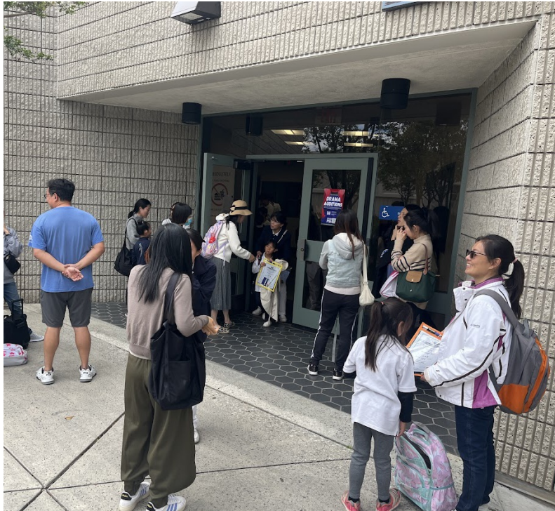
比賽時家長耐心的在場外等學生出來。