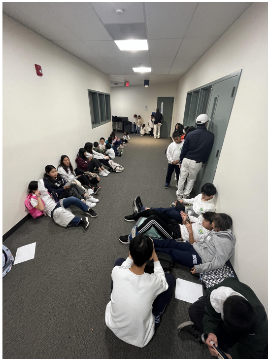
學生在比賽教室外利用時間用字卡或練習的識字檔練習。

每一位學生比賽時間定為兩分鐘，兩分鐘內除了念出生字以外，學生還須用生字造一詞。比賽成績以唸對生字和造詞的數量計算。所有參賽學生，可以拿到學校提供之參加獎獎狀和一份小禮物以茲鼓勵。學校根據最後計算出的比賽成績，頒發獎狀及獎盃給每一年級的前三名或前四名學生。