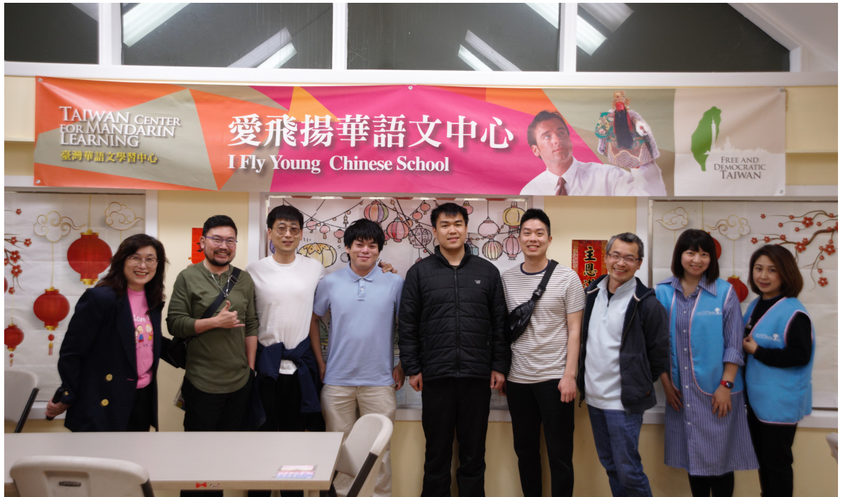
愛飛揚華語文中心TCML學生及老師合影