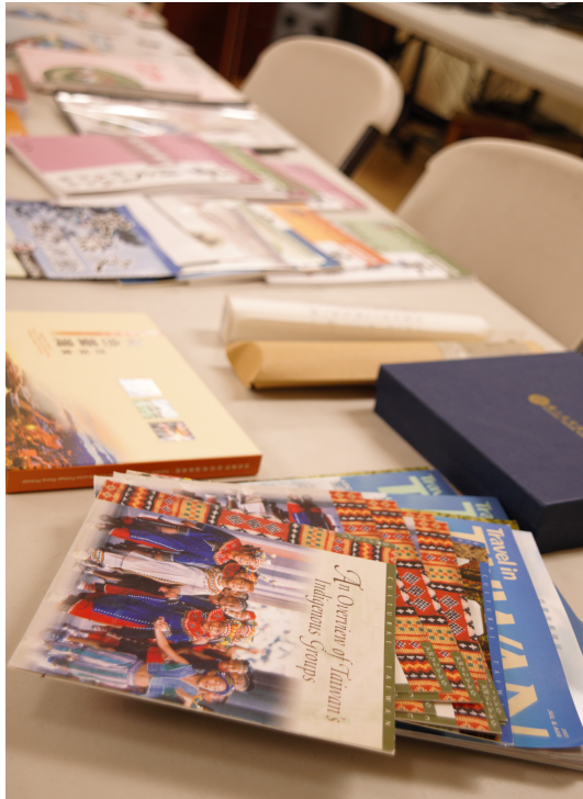
教材區；TCML 上課用到的各式教材、課本和課外讀物