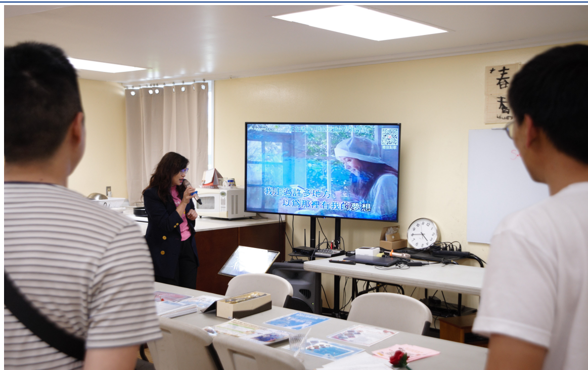
示範教學；TCML-IFY 從唱歌學中文