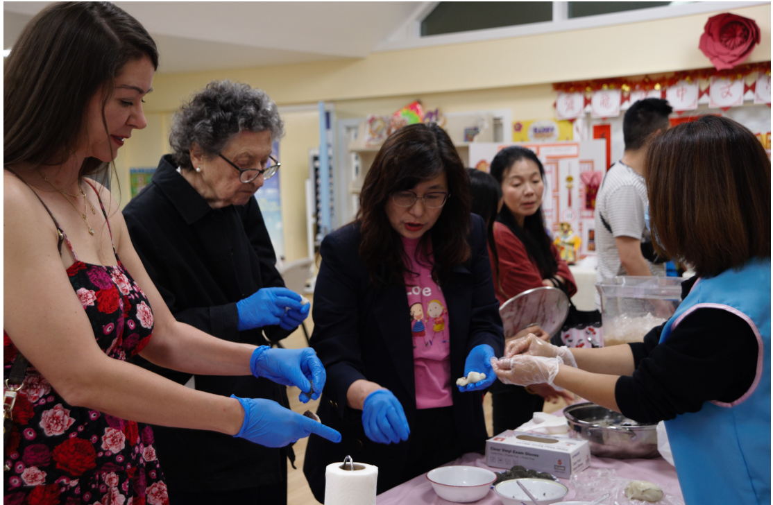
文化體驗區-現場DIY包麻糬教學