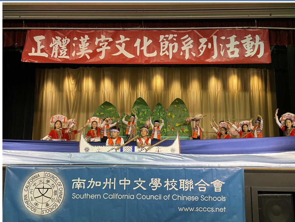
聖瑪利諾中文學校[站在高崗上]舞蹈呈現原住民與大自然融合的在地文化