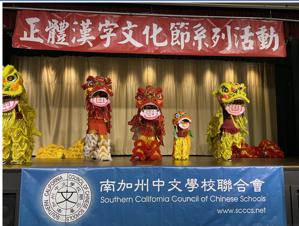
Ce中文學校以祥獅獻瑞揭開2024漢字文化節漢字文化節