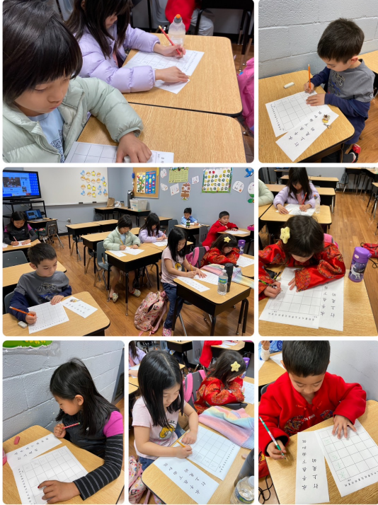
參賽學生專注書寫漢字