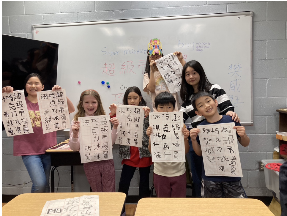
老師帶領學生一同參與書法比賽，認識漢字之美