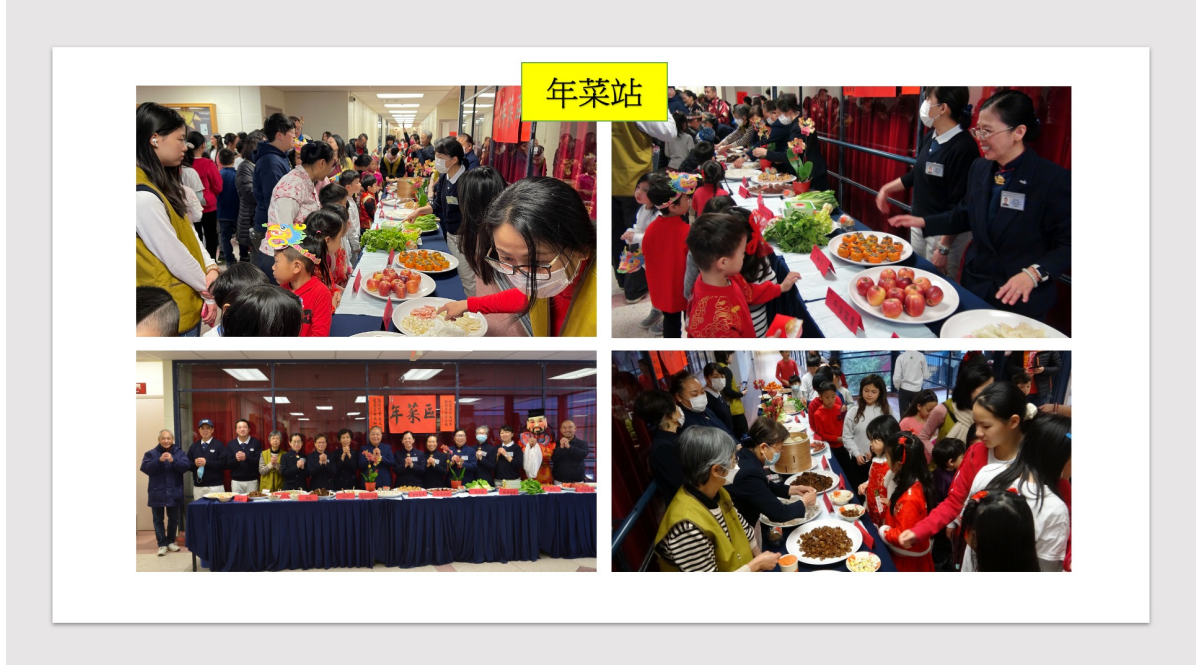
年菜站展示各式各樣的年菜及對應的吉祥話