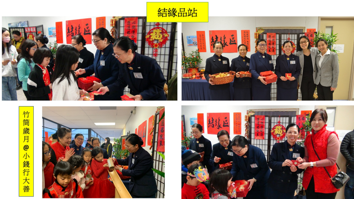
派發龍年紅包和結緣品及竹筒歲月站