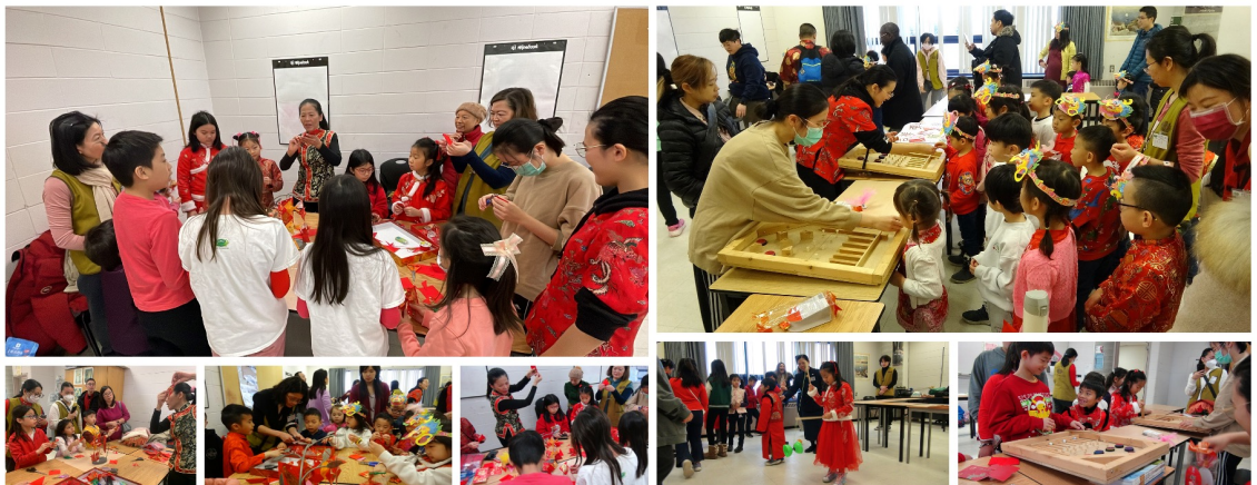
十二生肖配對樂、童玩及紅包魚剪紙