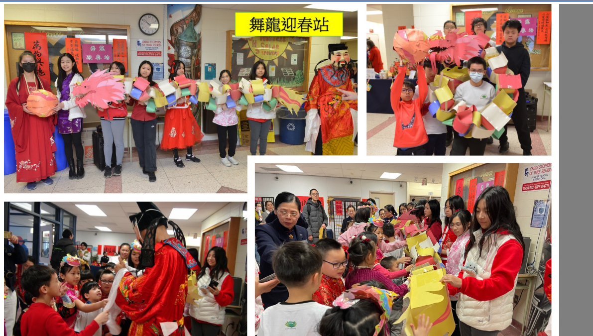
舞龍迎春及財神爺