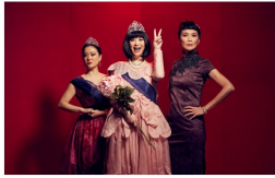
照片：Belvoir Street Theatre

推薦的原因： 劇情超級好笑，因為這齣戲不僅微妙地透露出不同世代間的觀念差異，同時也讓觀眾強烈地感受到不言而喻的親人關愛，以及來自各地方華裔彼此間的異同。