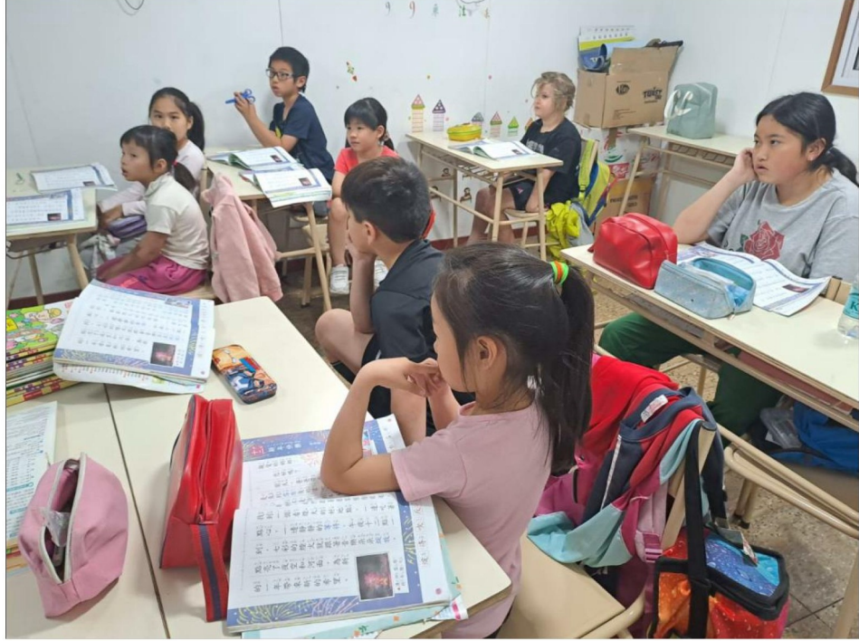
認真聽比賽規則的低年級學生