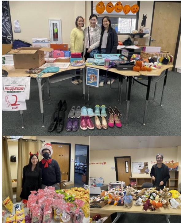
家長與志工們協助攤位。