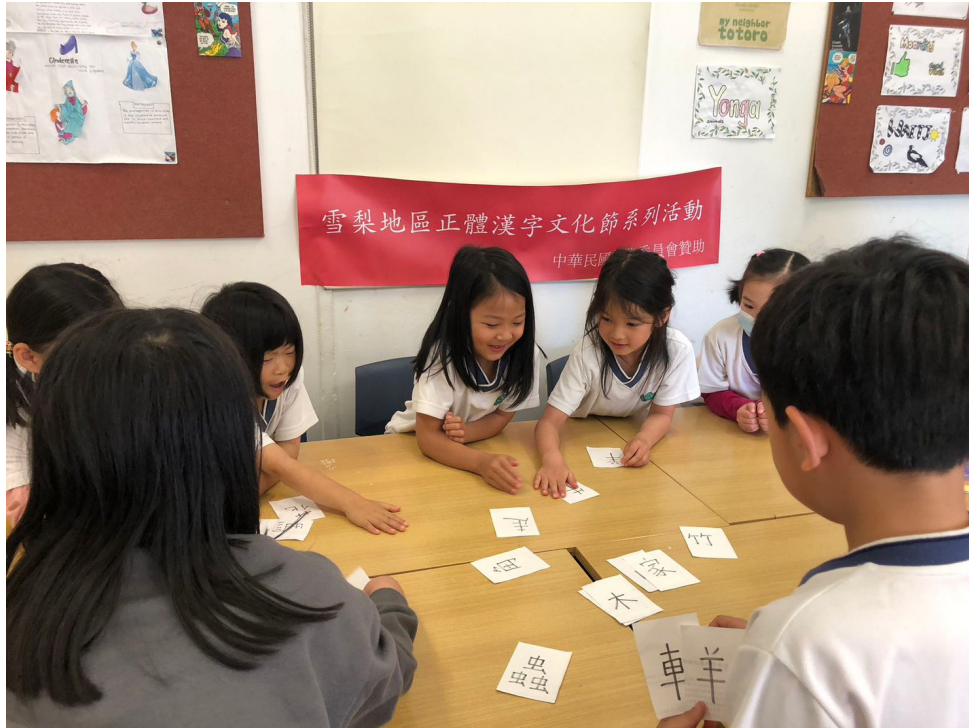
幼稚園組漢字闖關遊戲