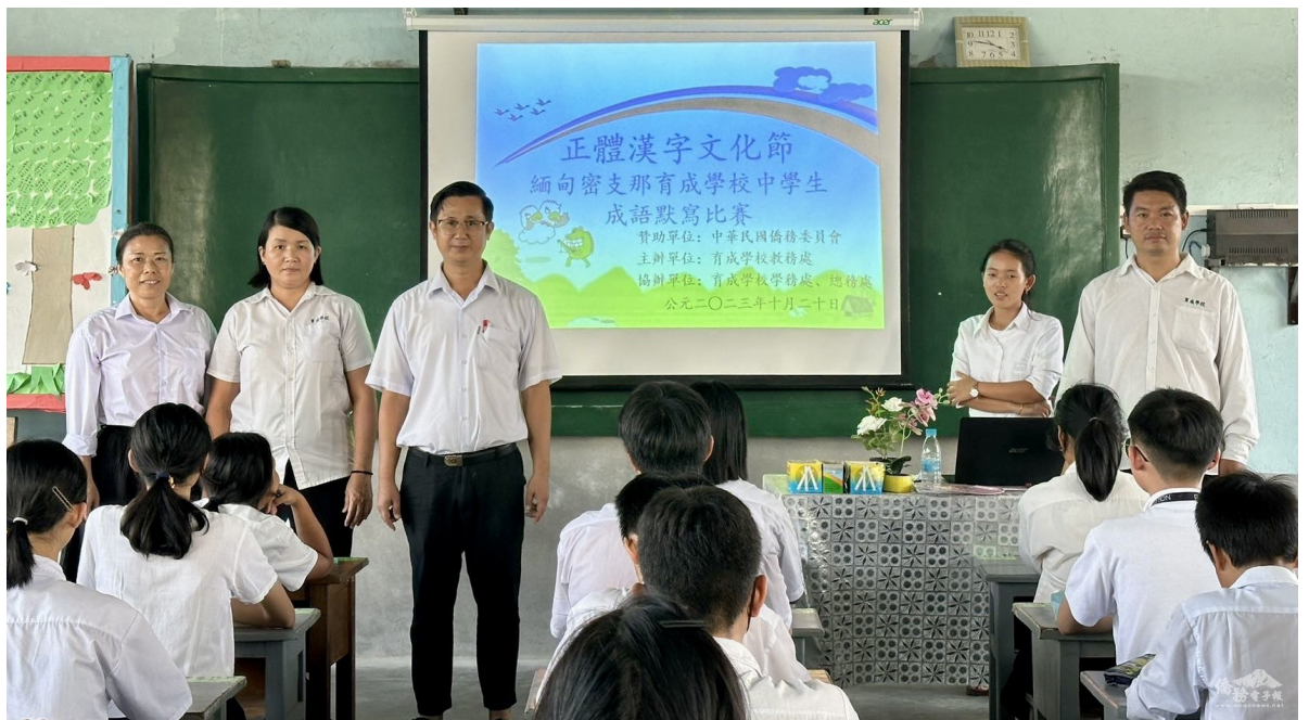
育成學校舉辦2023年度正體漢字文化節成語默寫比賽

育成學校表示，此次活動不僅豐富同學們的課餘生活，更讓他們能認識到應用書寫成語的重要性，拓展對成語學習的知識，也提高使用成語的意識和能力，充分激發同學們學習優秀中華傳統文化的熱情。學校進一步表示，藉此契機，希望讓規範書寫漢字成語伴隨學生的每一天，為以後學習奠定良好的基礎，還能以成語故事來育人，營造良好學習的書香氛圍，促進學生健康成長和全面發展。 育成學校 釗有芬 供稿