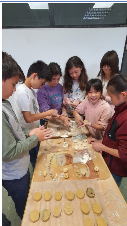
包月餅活動-全班一起做月餅好開心!