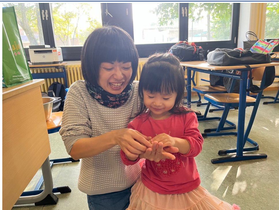
包月餅活動-學員與家長一起包月餅，超級開心!