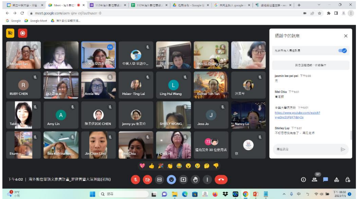
本次數位課程初階班師生合影