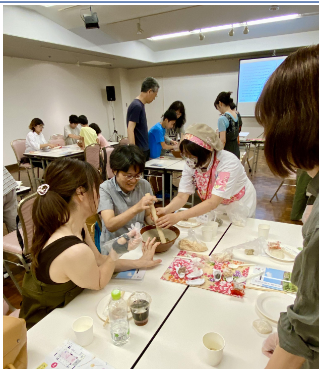
帶著大家一起手把手體驗客家擂茶