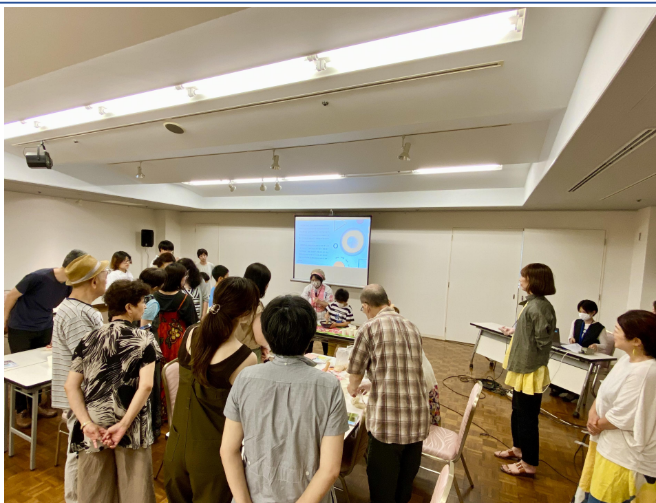
示範客家擂茶及客家麻糬做法