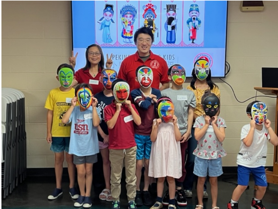
學員製作創意臉譜