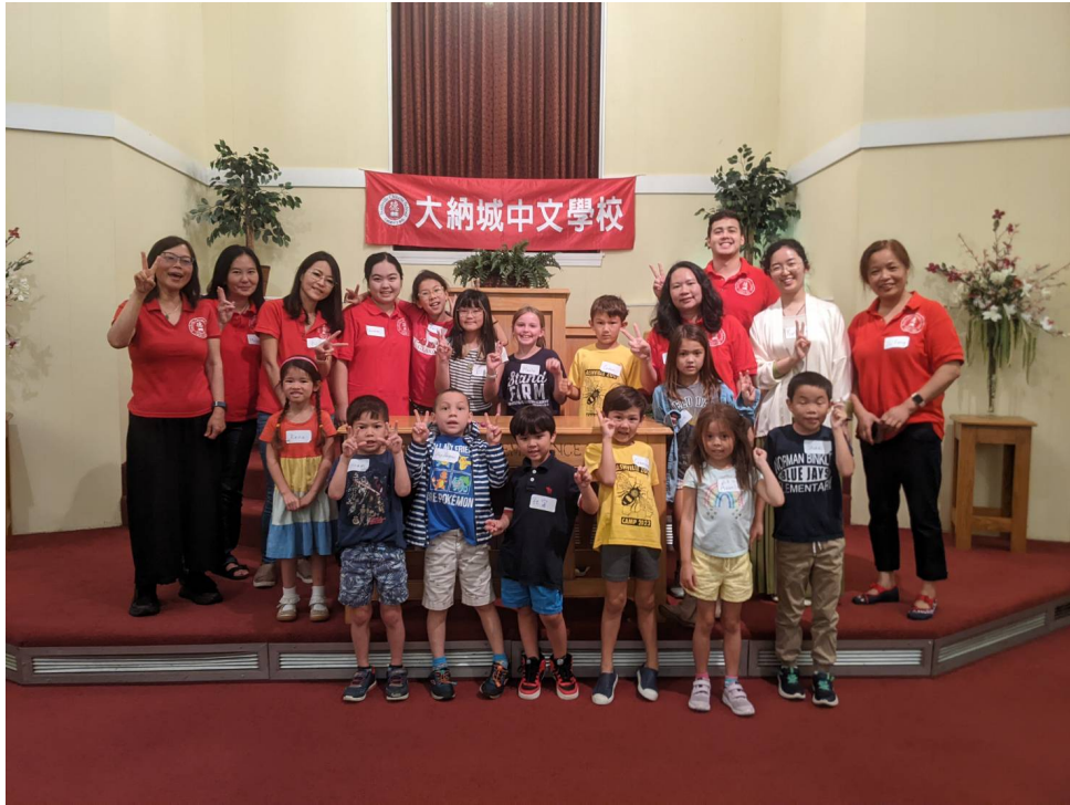
大納城中文學校夏令營，學員收穫滿滿