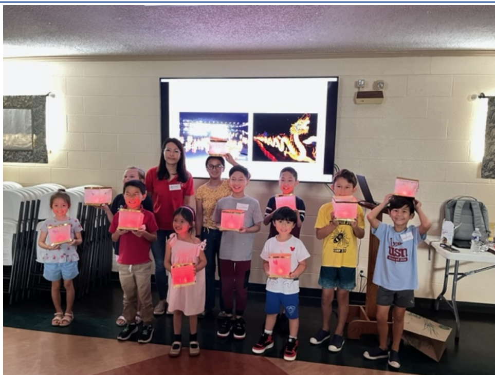
蘊含祝福的水燈製作