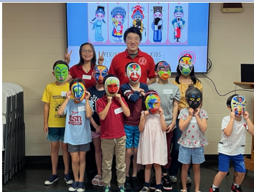
學員製作創意臉譜