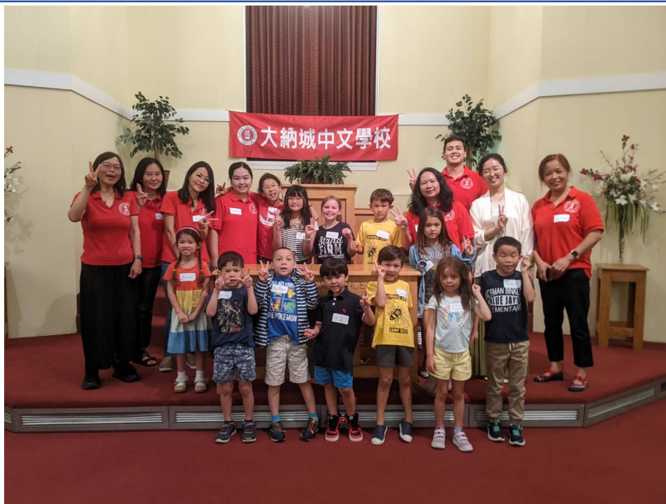
大納城中文學校夏令營，學員收穫滿滿