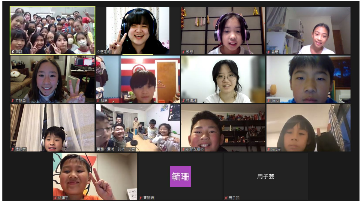
鳳興書院與雲林縣安慶國小畢業班線上交流合影