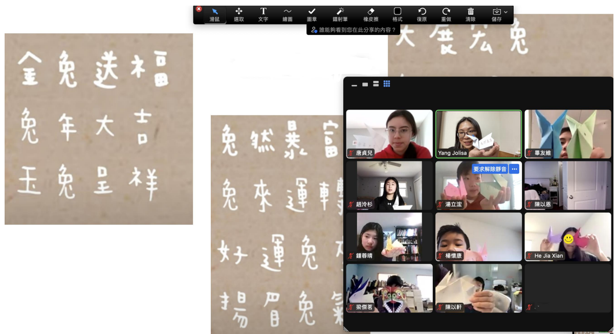
福兔迎春 - 手工摺紙和玉兔吉祥話。

兩校攜手合作，不僅促進了華語教學的發展，還讓學生們在這一年中取得了豐收的成果，給學生們帶來一個豐富而有意義的學習經歷。兩校皆表示這兩年的合作非常愉快，也期待未來這樣的合作能繼續延續。除了提供臺灣華語老師更多的機會與經驗，更為美國的學生提供了優質的華語學習機會。