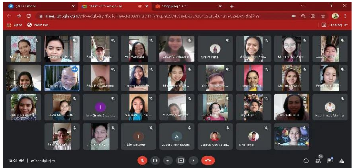
圖3:學生在線上注意聽老師講臺語課