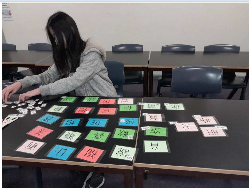
學生進行漢字辨識配對