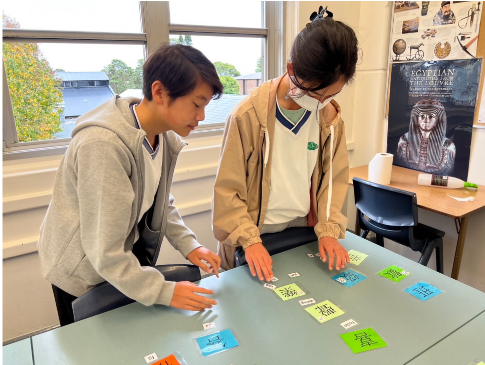
高年級學生漢字辨識