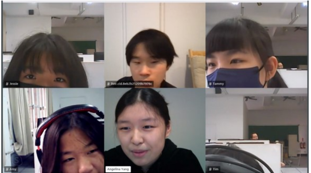
小老師和甲仙國小同學認真上課