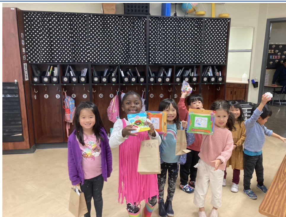
K班 看字卡讀出注音、上課學過的字、或回答簡單的問題