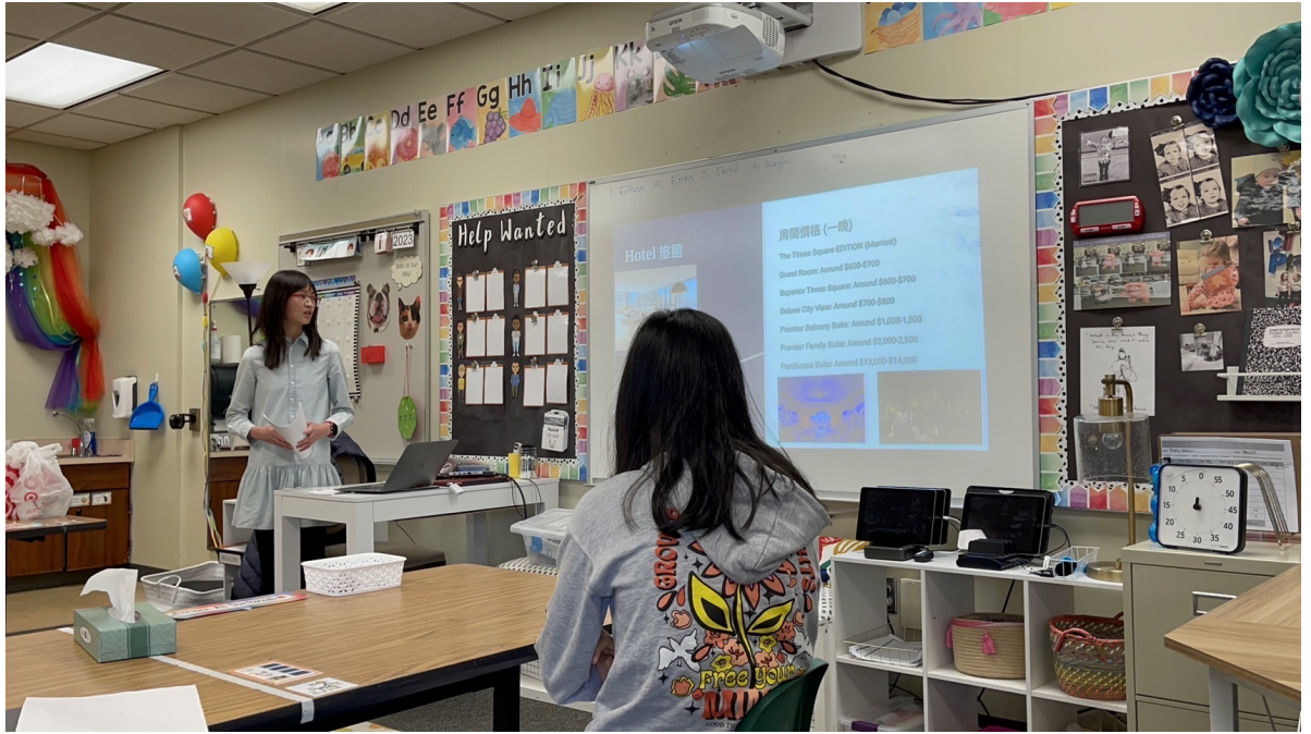
8年級 我的夢幻之旅：一個兩天一夜旅遊的提案