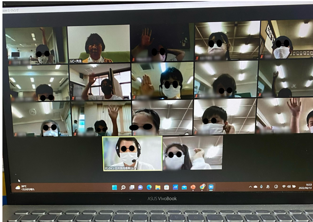
大阪線上國際俱樂部～台灣文化線上課程