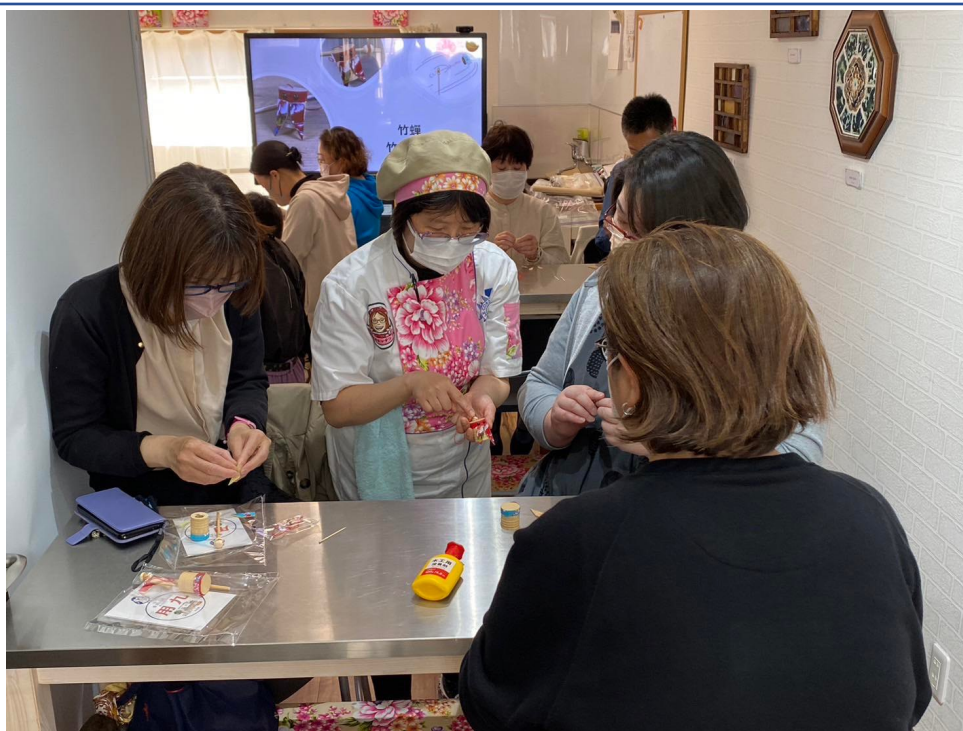
教授大家製作客家花布的台灣童玩-竹蟬