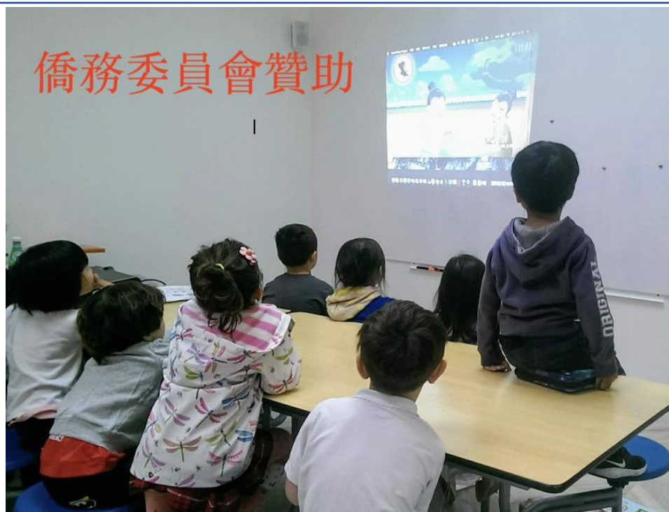
TCC漢字聽說讀寫挑戰賽