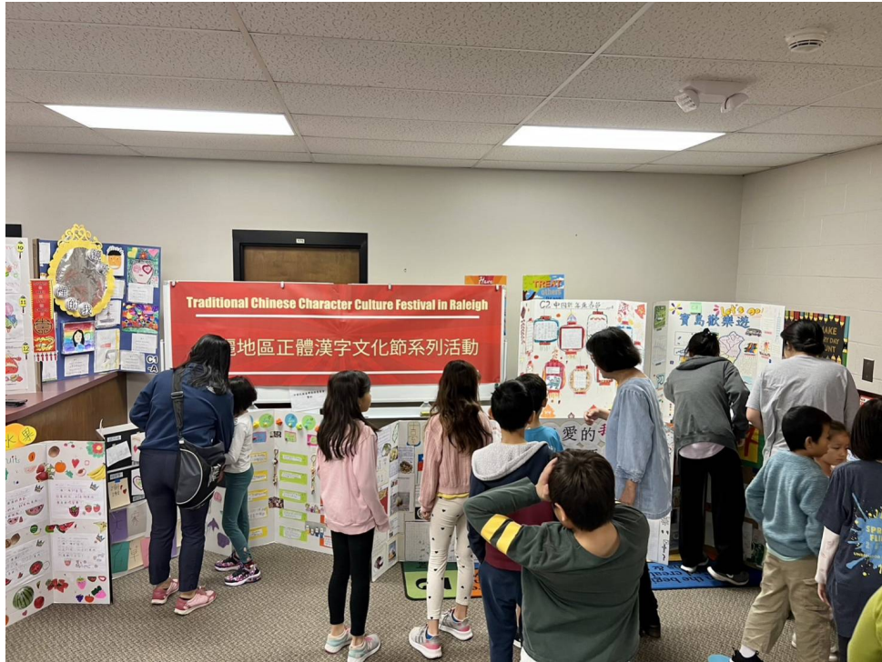
老師帶領學生參觀各班海報