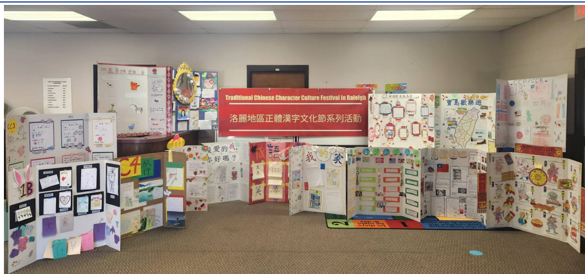
參加 2023 正體漢字文化節海報競賽的班級海報