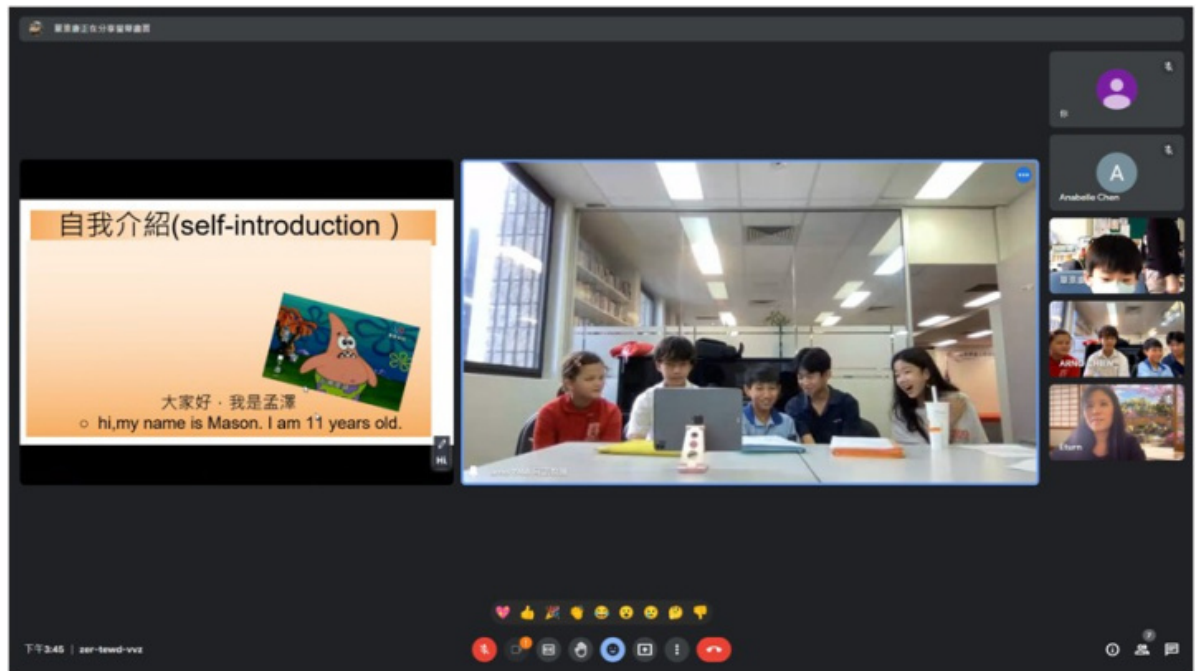
臺灣新竹竹蓮國小學生自我介紹