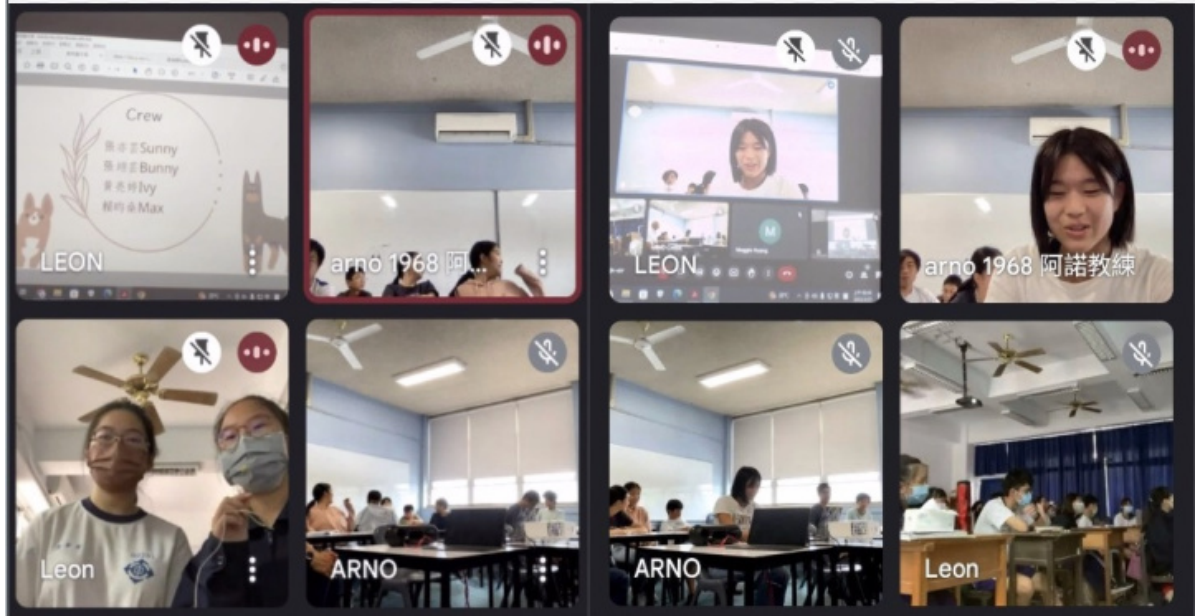
苗栗公館國中與雪梨臺灣學校學生互動