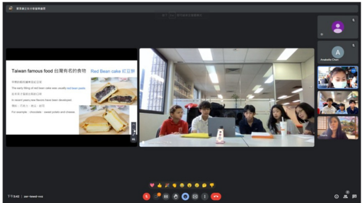
臺灣新竹竹蓮國小學生分享紅豆餅