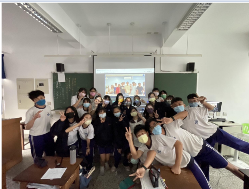
雪梨臺灣學校和苗栗公館國中學生合影