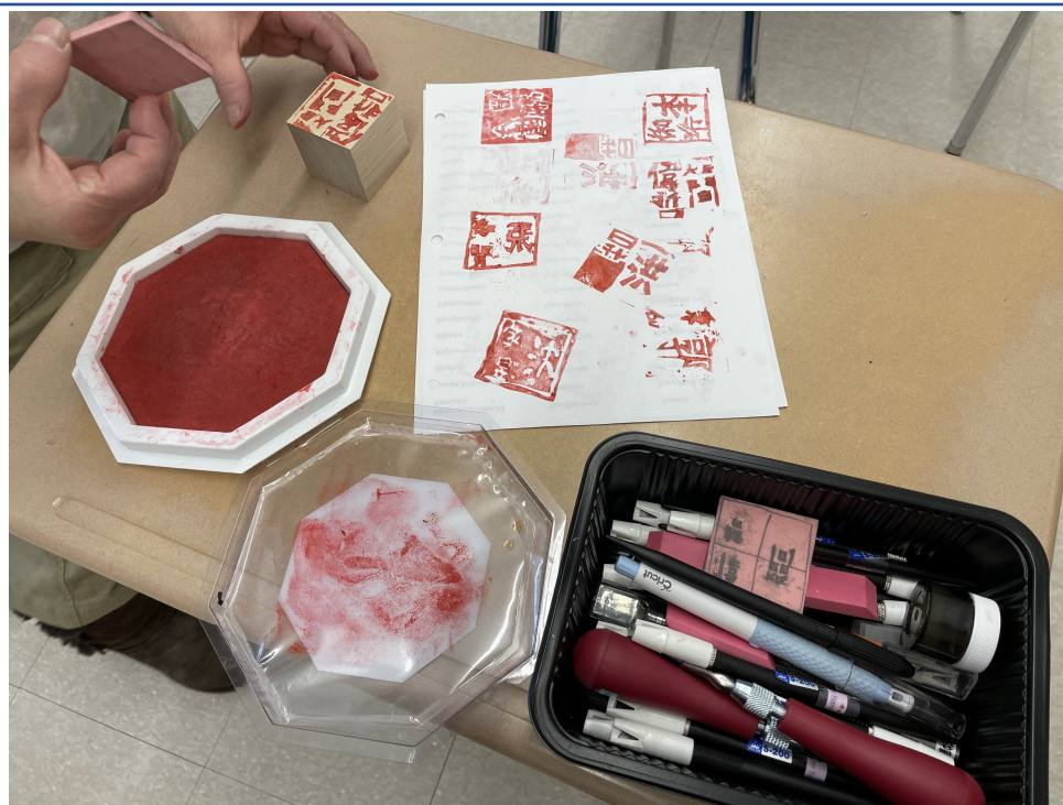
同學們刻印的成果！