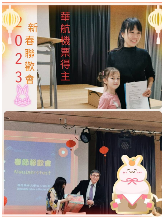
華航機票幸運得主

下午則是摸彩時間，是每年晚會最讓人緊張的時刻，今年共計有兩百多個獎項；在兩個小時裡，總是聽到驚喜聲、歡呼聲，此起彼落；最後到了兩張機票大獎時刻，找到了兩位幸運人士，更是歡聲雷動，為大會畫下了開心的句點。