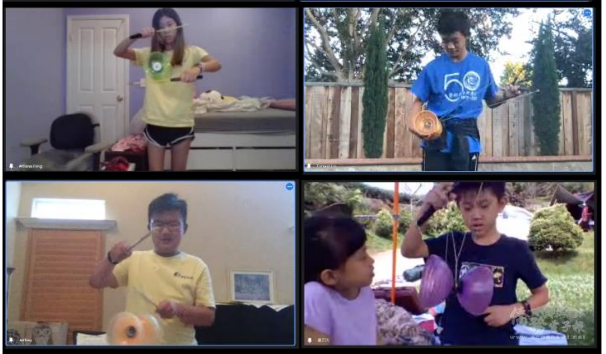
雙方學生展示以單鈴為主的纏繞招式或套路。