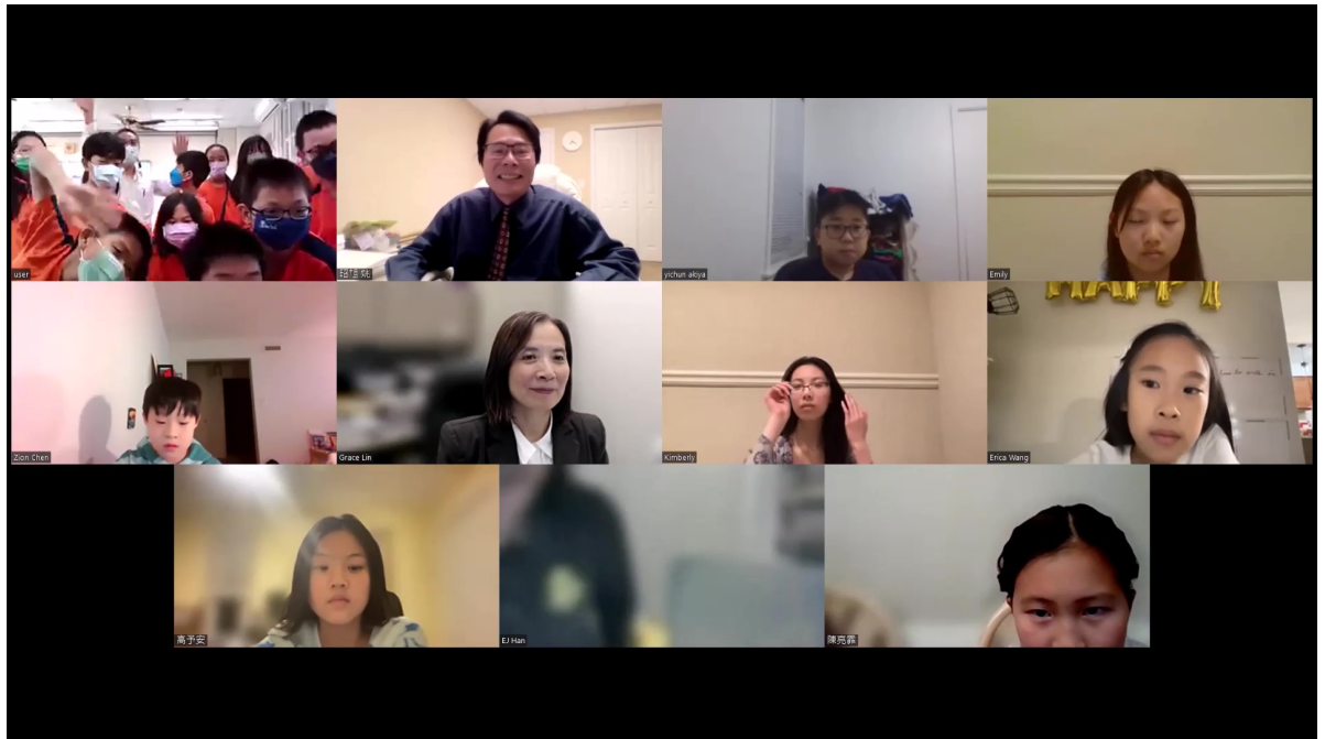
國際數位學伴計劃大合照