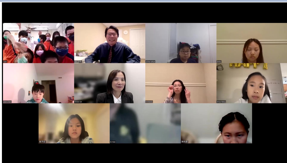
國際數位學伴計劃大合照